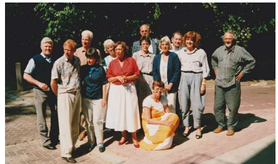
1 Gastdocenten bij de oprichting in 1988

In 2023 bestond onze stichting 35 jaar. In 1988 begon de stichting met ongeveer 25 gastdocenten die voortkwamen uit de Vereniging van Kinderen uit de Japanse Bezetting en de Bersiap '41 – '49 (KJBB). Jan Willem Hoegen werd voorzitter en bleef dat ruim 25 jaar. Met zijn bestuur groeide de stichting tot meer dan 100 gastdocenten. Ook werd een reizende fototentoonstelling aangeboden. Na het vertrek van Jan Willem Hoegen in 2015 kreeg de stichting het moeilijk, het aantal gastdocenten van de 1 e generatie liep sterk terug en er was diens gevolg krimp in het aantal gastlessen. Toch bleef de stichting actief. Mede door de toestroom van 2 e en 3 e generatie gastdocenten kunnen we inmiddels weer spreken van groei in zowel het aantal gastlessen als het aantal actieve gastdocenten en aspirant gastdocenten. De stichting heeft in die 35 jaar ruim 250 actieve gastdocenten als vrijwilliger mogen begroeten. Er zijn naar schatting 150.000 scholieren bereikt tijdens de gastlessen. Helaas is in 2023 Jan Willen Hoegen, die zo belangrijk was voor onze stichting, onverwachts overleden waardoor hij het 35-jarig jubileum niet kon meemaken.